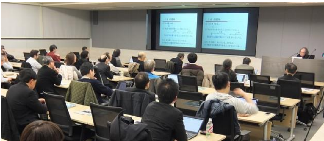
「型の理論」と証明支援システム --- COQの世界」