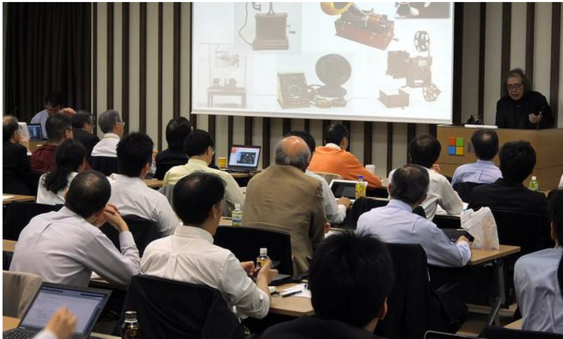
「BITCOIN と分散暗号通貨を考える」