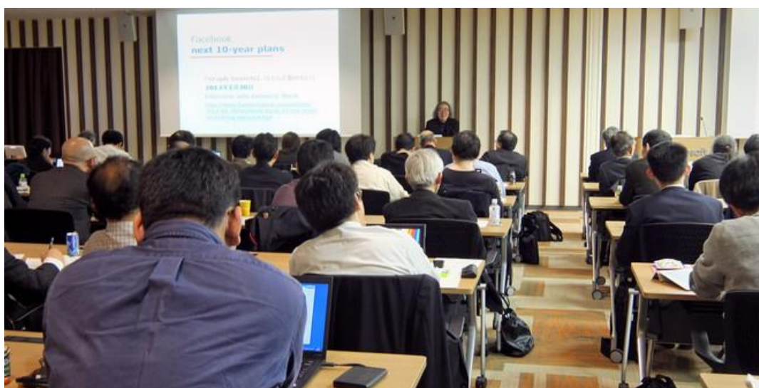
「大規模グラフデータ処理」